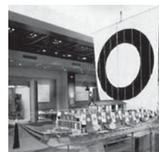
高松藩御座船「飛龍丸」

参勤交代に使われた高松藩の御座船「飛龍丸」の帆をモチーフにした認定マーク。「飛龍丸」の豪華な飾りに多くの人が見物に訪れるほどであったことから、集客誘致を連想させる。