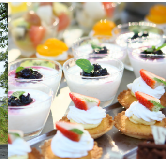
イングリッシュガーデン・レールサクレの「アフタヌーンティパーティ」